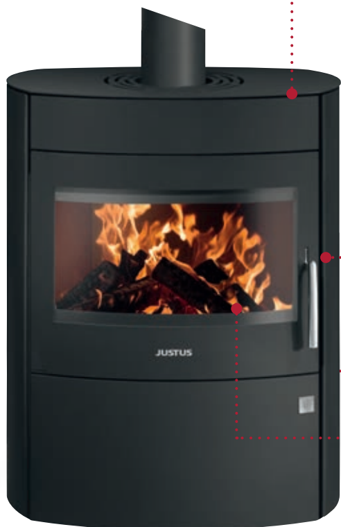
Agero 2.0 Korpus Stahl Schwarz